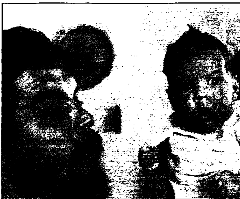
غيفارا مع ابنه كاسيلو في مافانزا عام 1962